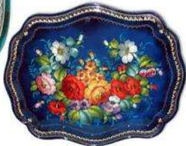
букет в раскидку